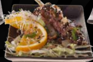
97. Gemarineerde lamsspies