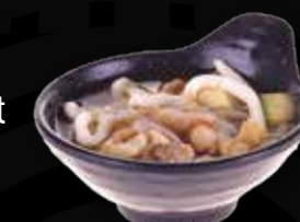
103. Noodlesoep met kip