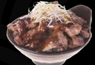
88. Beef Teriyaki