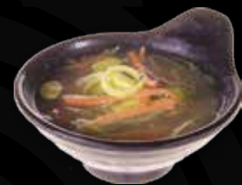
102. Miso soep