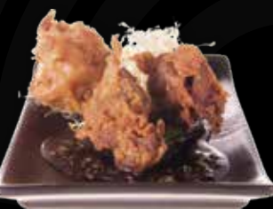
92. Gefrituurde kip