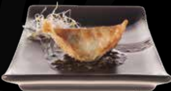
86. Garnalen pasteitje