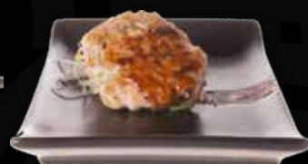
85. Spicy chicken burger