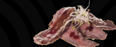
93. Koude beefreepjes met Teriyakisaus