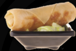
99. Kip loempia