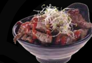
90. Spicy beef