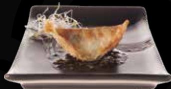
84. Kip pasteitje