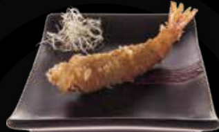
94. Panko garnaal