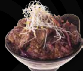
89. Beef met pepersaus