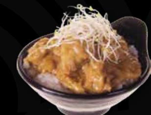
91. Kip curry met rijst