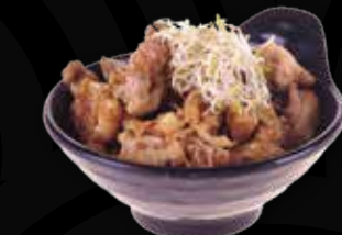
87. Kip Teriyaki