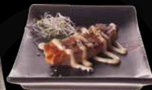
98. Pittige zalm